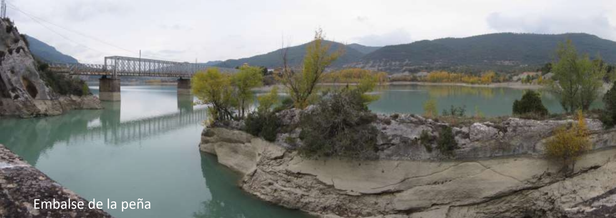
Embalse de la Peña