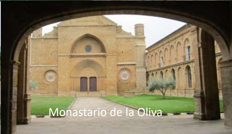
Monasterio de la Oliva